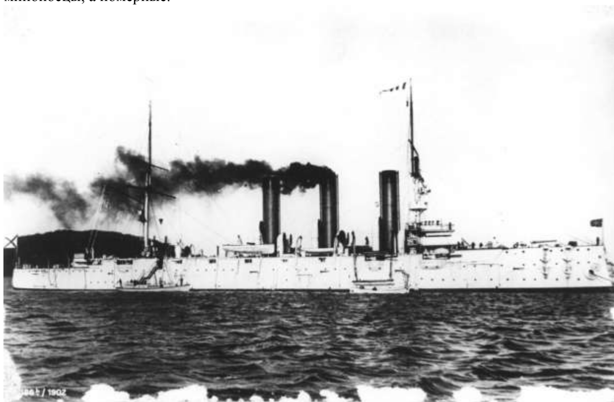
Бронепалубный крейсер I-го ранга "Диана" в 1902 году

Миноносец «Грозовой» шел все время за нами. Он главным образом и передавал о присутствии и движениях неприятельских миноносцев за кормой. На него самого неприятель не обращал внимания. Он свободно с нами держался, и тот факт, что ему погода не мешала идти, и заставляет думать, что за нами гнались не эскадренные миноносцы, а номерные.