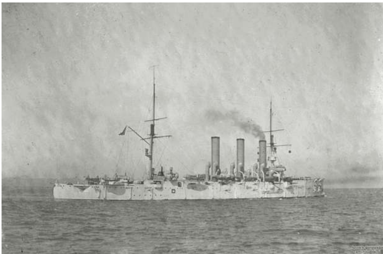
Бронепалубный крейсер I-го ранга "Диана"