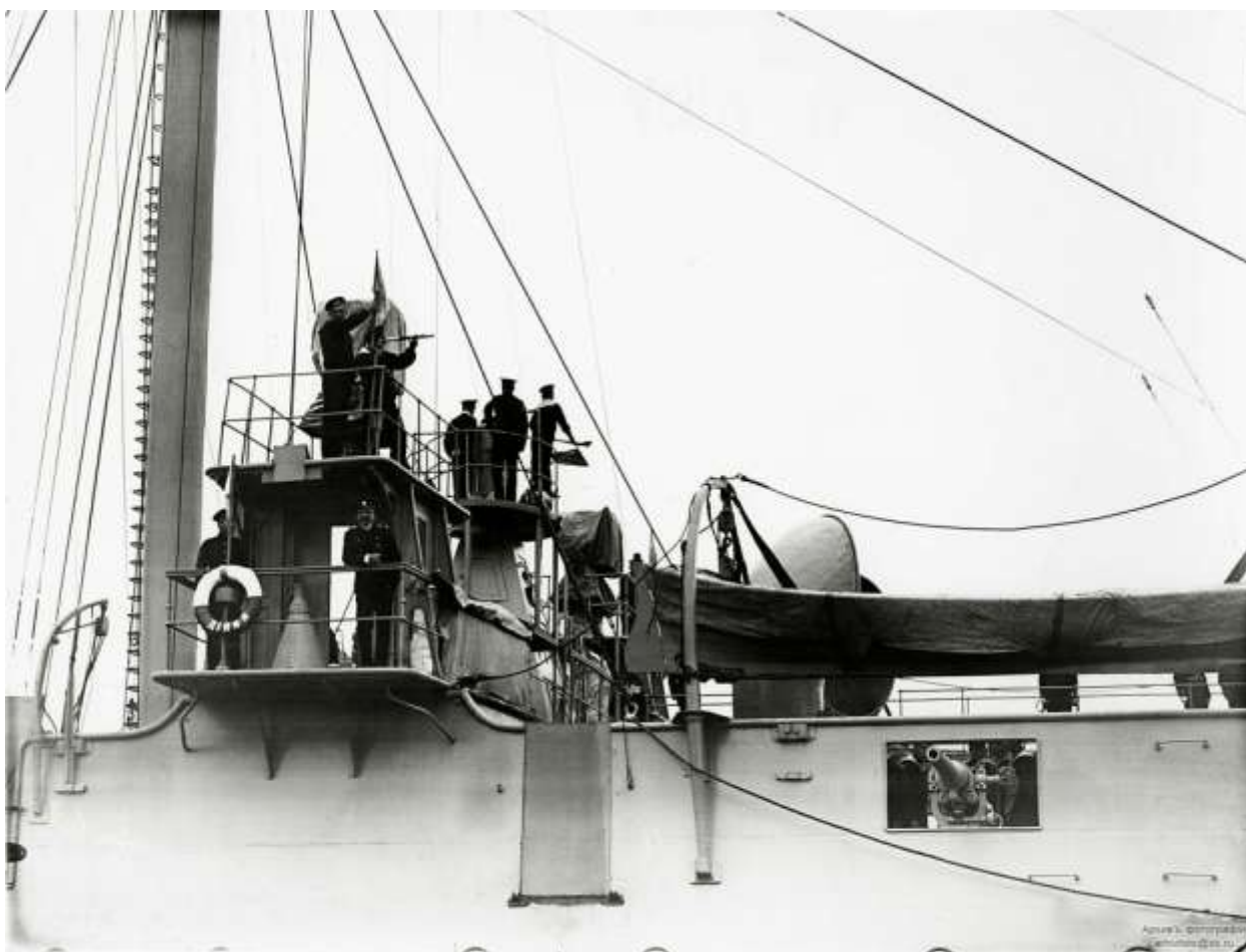
Бронепалубный крейсер I-го ранга "Диана". Кормовой мостик